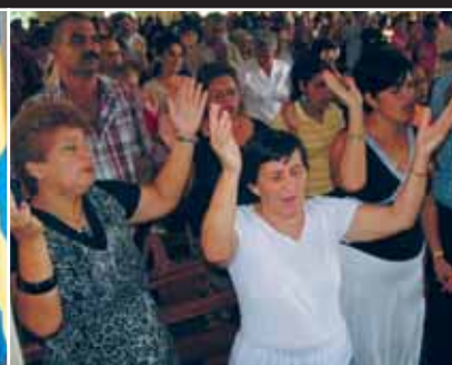
Publikbild från pastorskonferensen på Kuba. Ovanligt många kvinnliga ledare deltog.