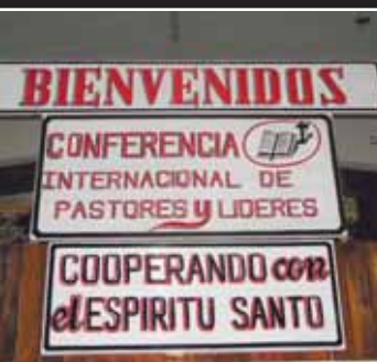
I kyrkan välkomnades konferensens deltagare av denna fina välkomsthälsning.