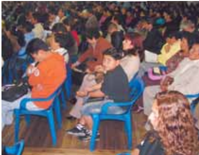
Publikbild från söndagens första Gudstjänst 07.30

Skivorna kostar 60:- per styck inkl. porto. Priset gäller till årets slut. Våra adresser finns på första sidan. Fler titlar finns på hemsidan