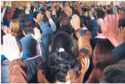
Församlingen sträckte sina händer i lovsång och glädje inför Gud.