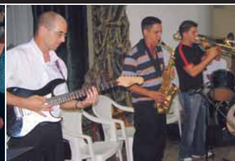
En del av pastorskonferensens musikgrupp.