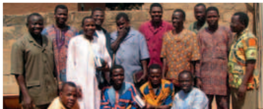
14 av 19 evangelister.

Framgångarna med de infödda evangelisterna har inspirerat oss att fortsätta detta arbete. Efter tre år sa Gud; "Arbetet är inte färdigt ännu – verket måste fortsätta." I dag säger Gud samma sak; "Arbetet är ännu inte färdigt – verket måste fortsätta". Detta fantastiska missionsarbete är möjligt eftersom församlingar och enskilda står med oss genom bön och ekonomiskt stöd.